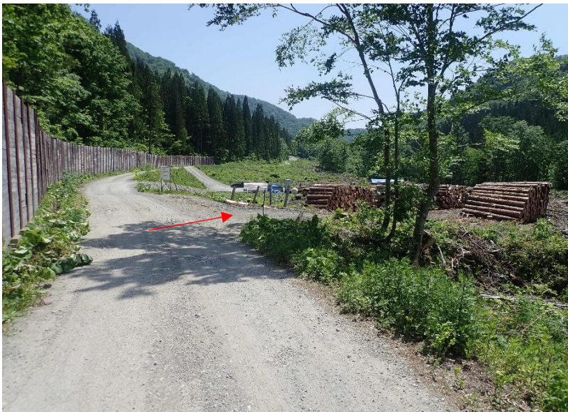
約50m先、右側に物件巻立