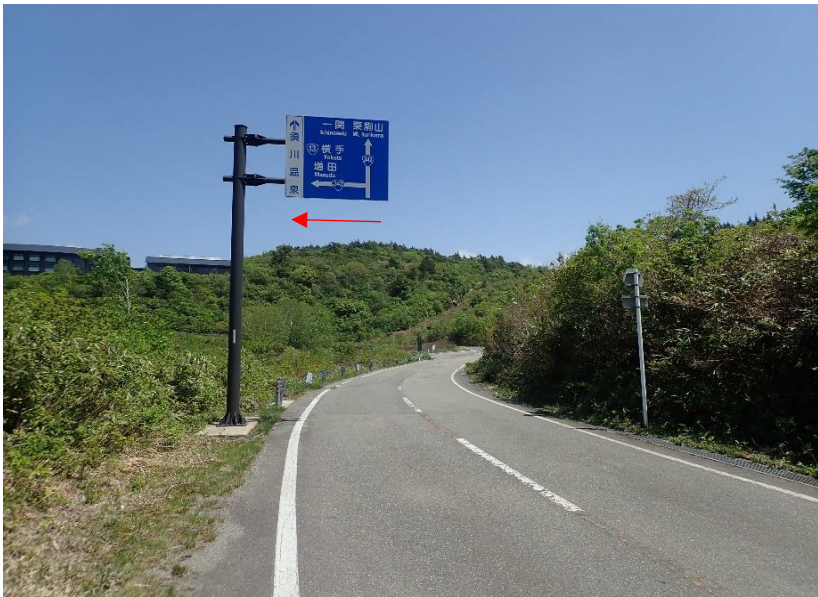
栗駒山方面からは須川温泉手前を横手・増田方面へ左折