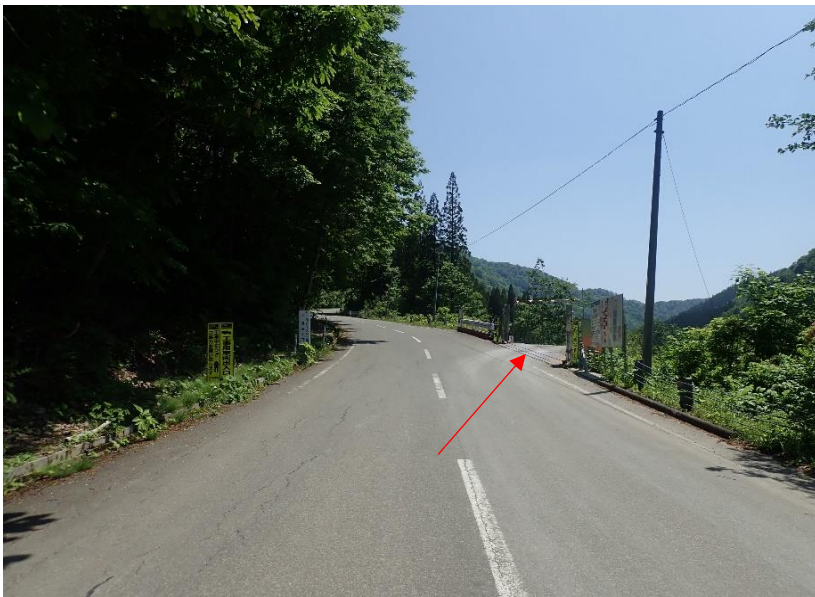
約18.5km先、右方向へ侵入（橋梁工事現場入口）