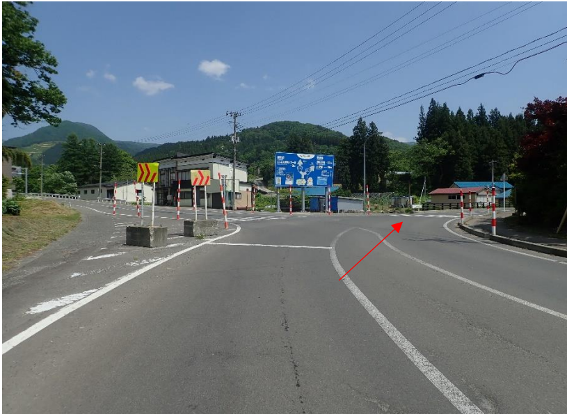
国道342号線（国道397号分岐）を直進（栗駒山）方面へ