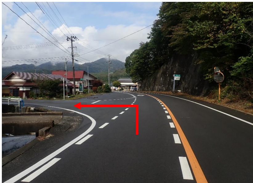
約3.2km先を左折（坂道を下ってすぐに左折）