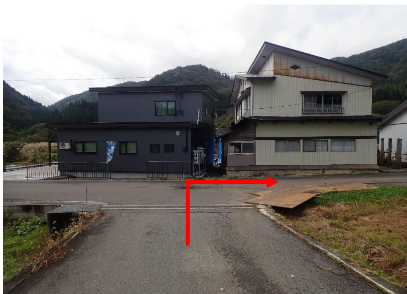
約1.1km先を右折（注意：急カーブに付き敷鉄板有り）