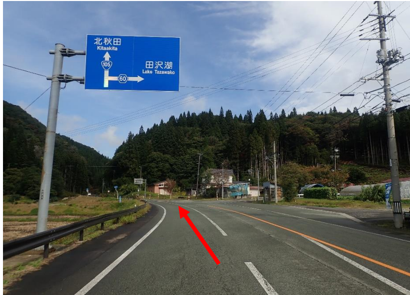
仙北市西木町の国道105号と県道60号の分岐を北秋田方向へ直進