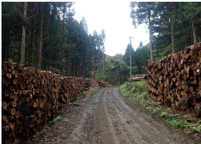
分岐を左折し約1.1km先に西の又山元土場