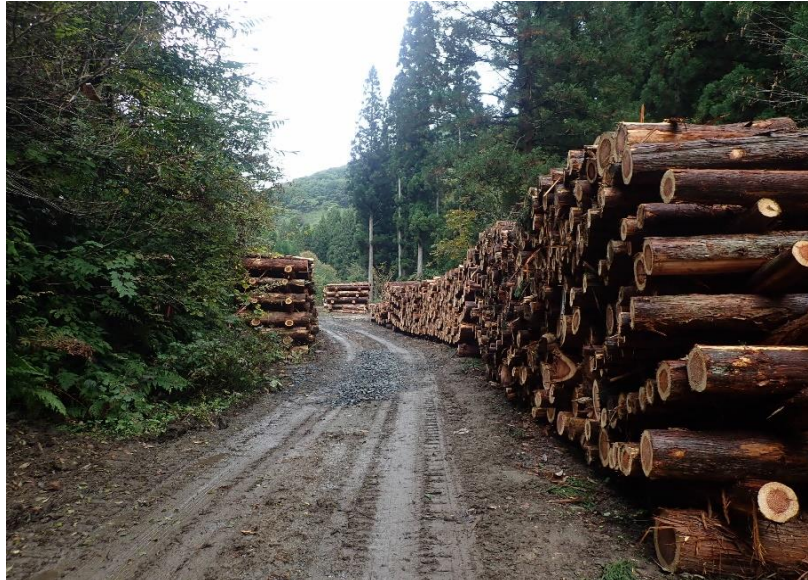
分岐を直進し800m先に東の又山元土場