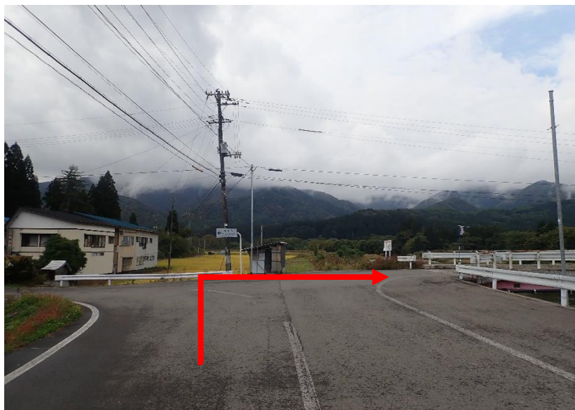
約1.3km先を右折（橋を渡ってすぐに左折）