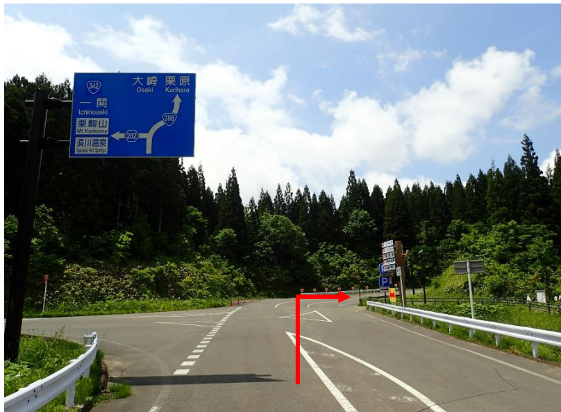
国道398号 大湯温泉から栗駒方面へ6.2 k m 右側