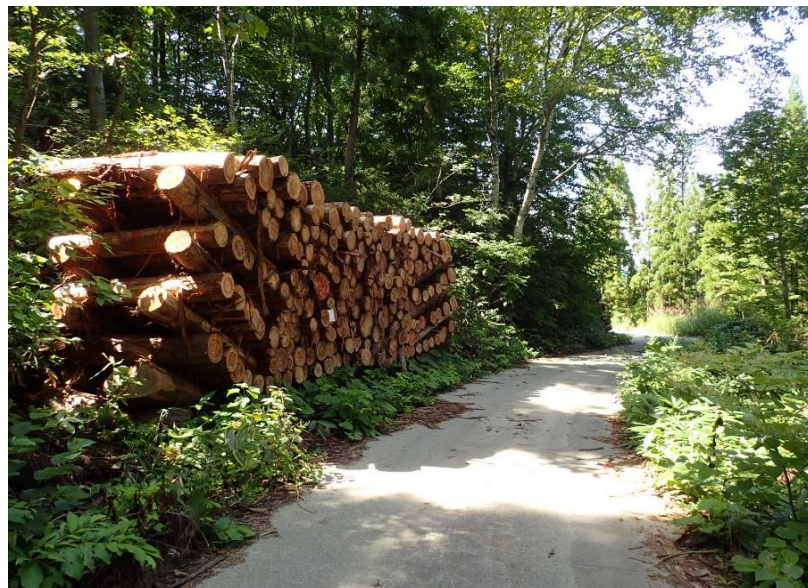
物件卷立状況 (2号物件)