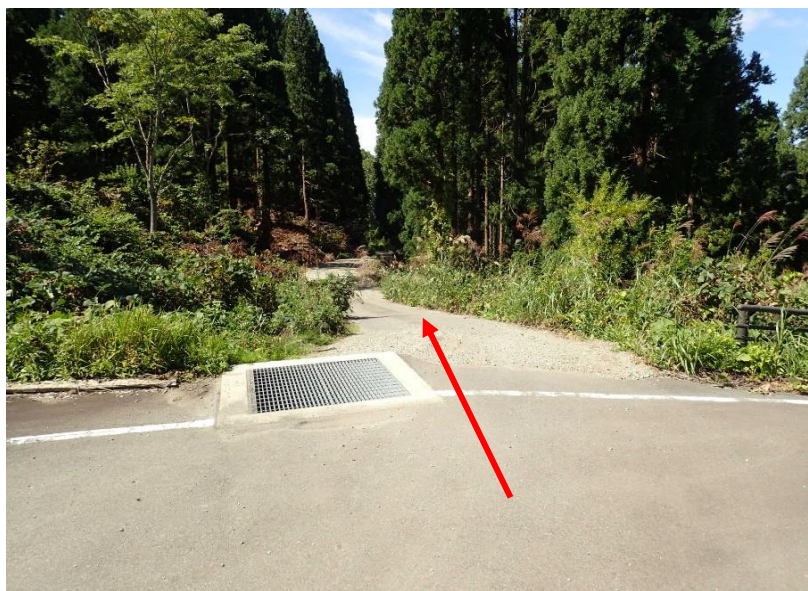
この先道幅が狭いので通行の際はご注意願います