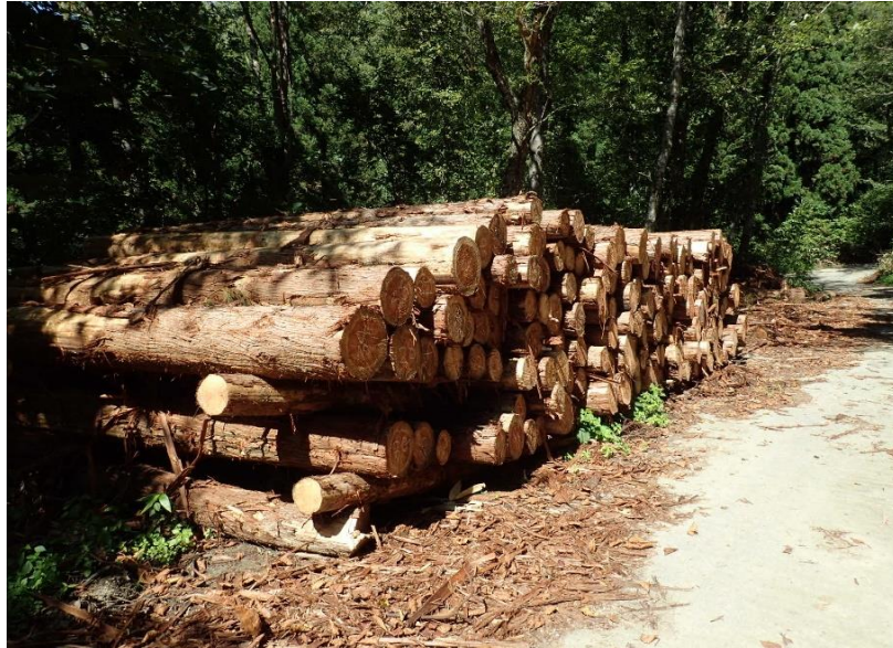
物件卷立状況 (1号物件)