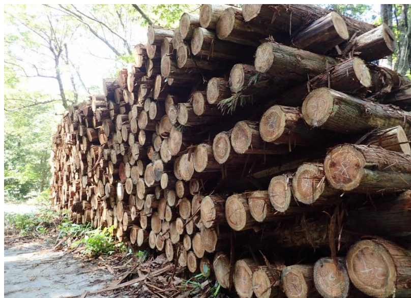
物件卷立状況 (3号物件)