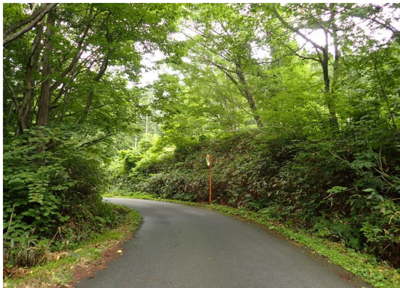
道幅が狭く発電所関係の工事車両が多いため通行の際はご注意ください