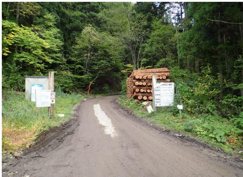
林道入口 生産事業の看板等有り