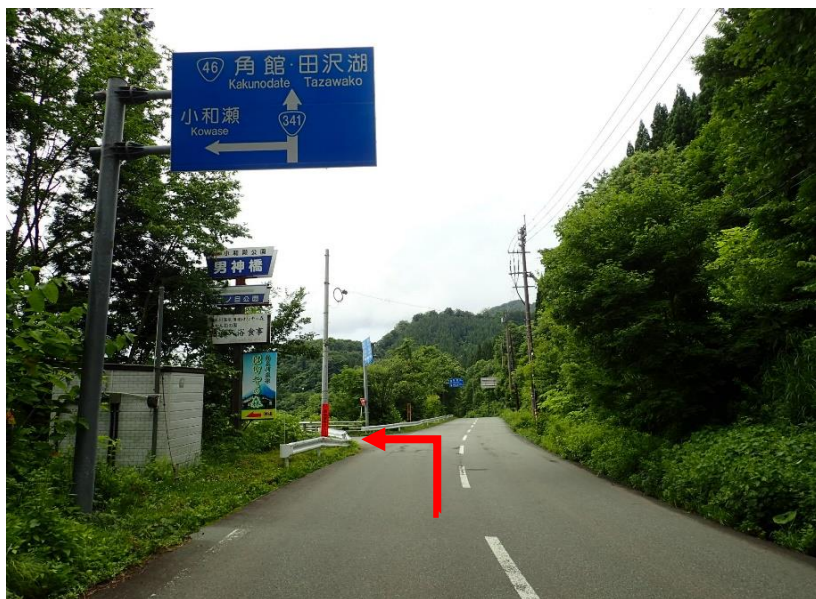
鹿角・八幡平方向からは左折