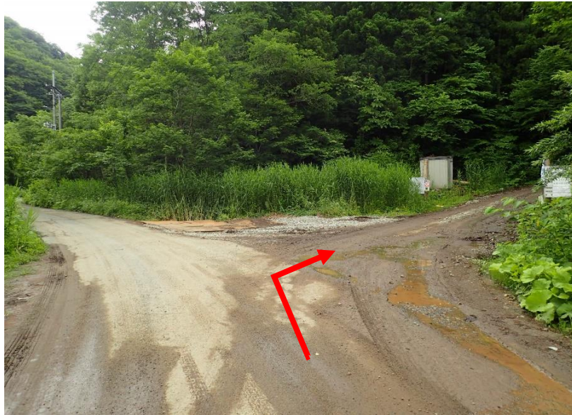
男神橋から約6.1km先を右折（小和瀬林道）