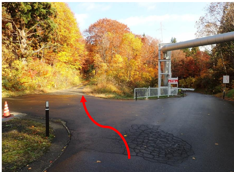
約200m先、三叉路を真ん中の林道へ