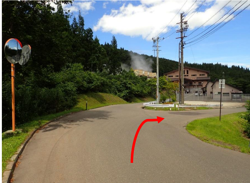
約1.3km先、上ノ岱地熱発電所が見えたら右方向へ