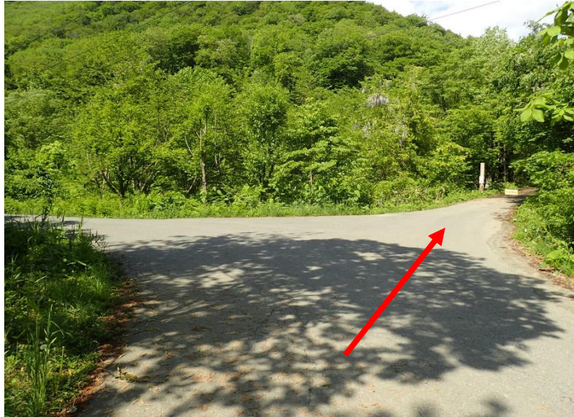
小和瀬第2土場は男神橋から約6.1km先を直進（上小和瀬支線）へ