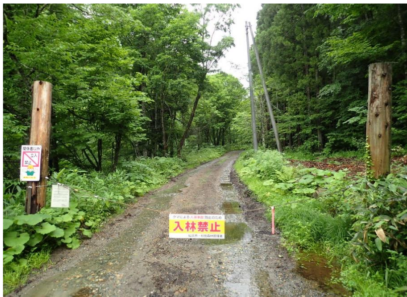
上小和瀬支線（小和瀬第2土場）起点付近（カギによる規制有り）