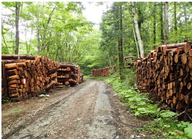
林道起点から400m先～物件巻立