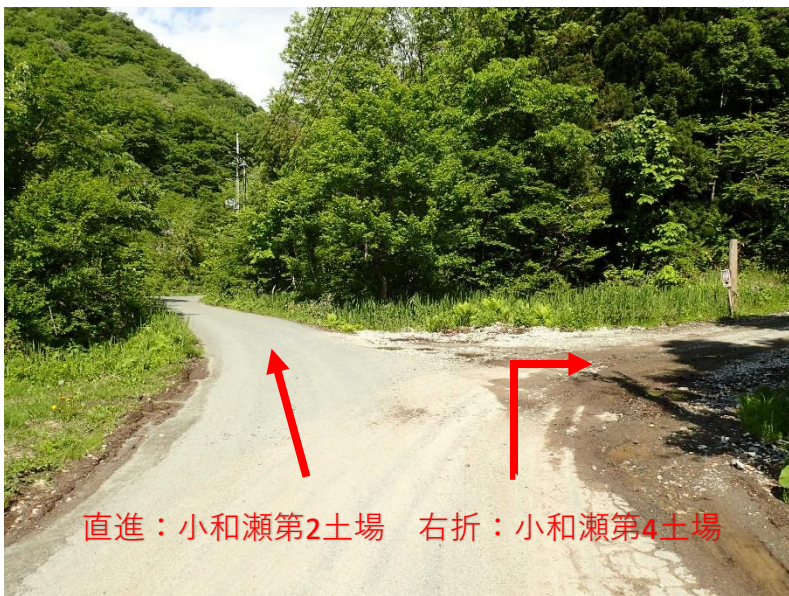
直進：小和瀬第2土場 右折：小和瀬第4土場