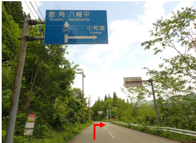
国道46号から国道341号へ入り約27km先を小和瀬方面へ右折