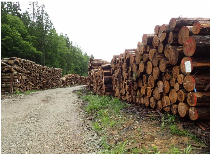
右折した小和瀬第1土場