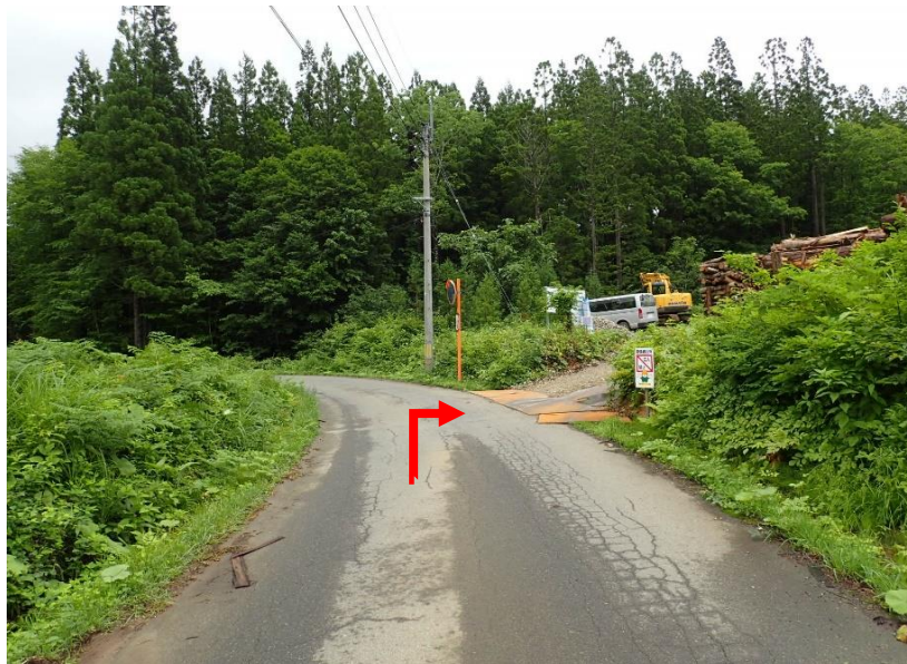
男神橋から約5km先を右折:小和瀬第1土場