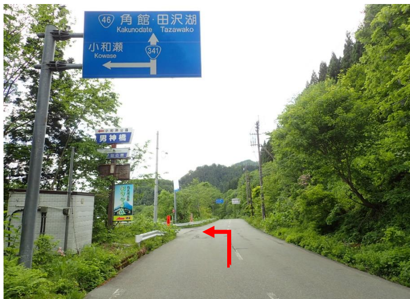
鹿角・八幡平方向からは左折