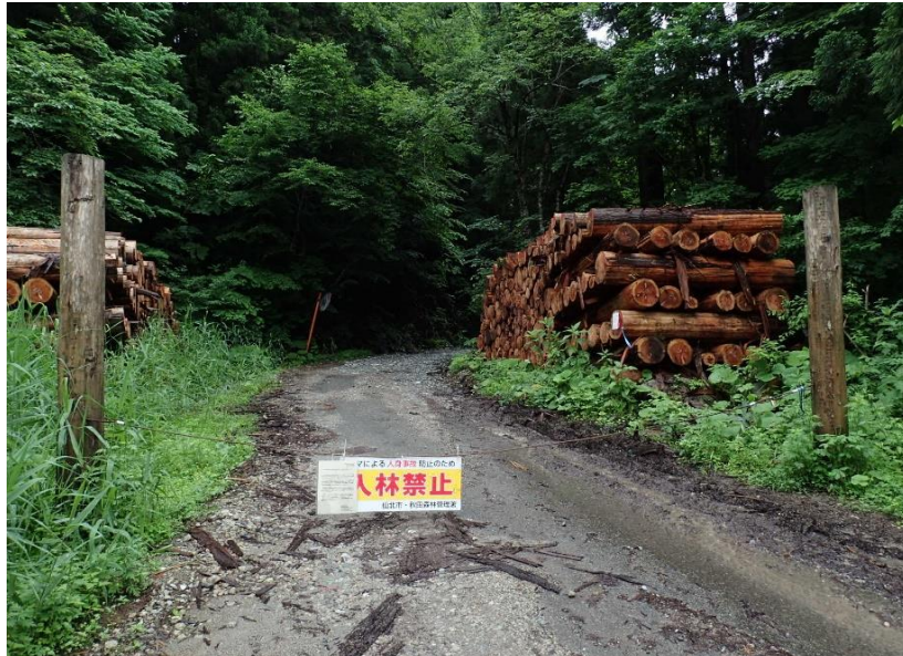
小和瀬林道（小和瀬第4土場）起点付近（カギによる規制有り）