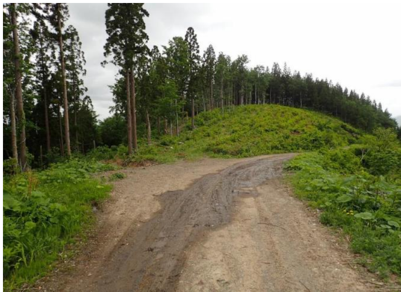
下ノ 岱林道起点から650m先のトラック転回所