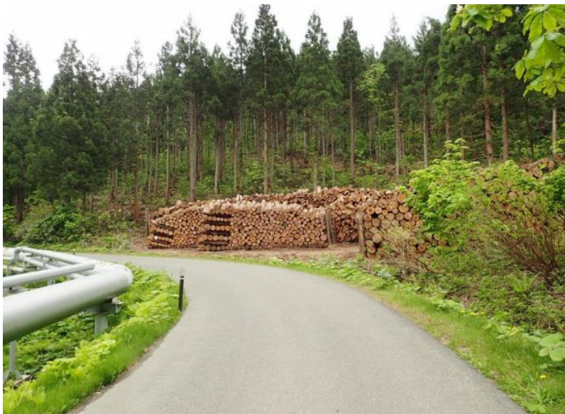
上ノ岱地熱発電所管理道路の300m先 37号～44号物件