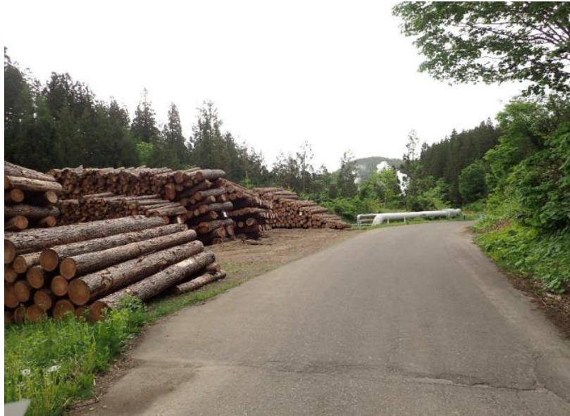
上ノ 岱地熱発電所管理道路の500m先 23号～36号物件