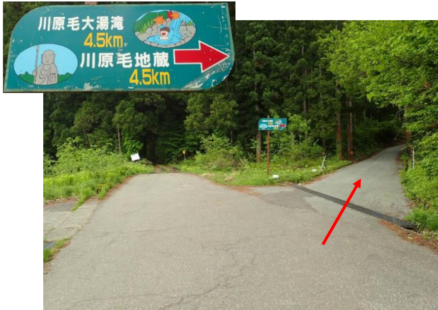
260m先を川原毛大湯滝へ右折