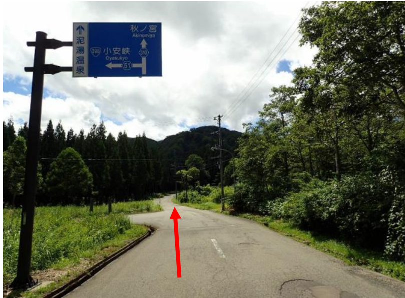
県道51号線から県道310号線（秋ノ宮・泥湯方面へ）