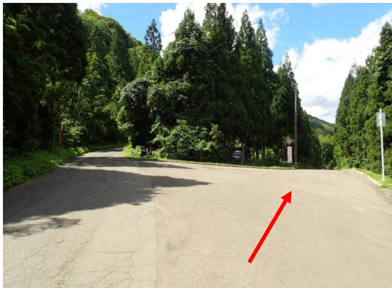
約2.4km先、右方向（上ノ岱地熱発電所方面）へ