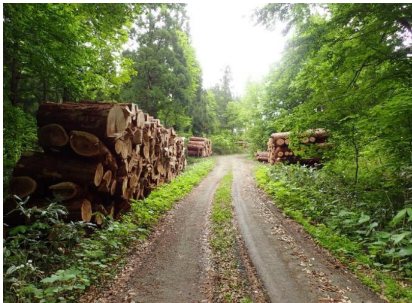
下ノ 岱林道起点から50m～950mの間に14号～22号、54号～64号物件