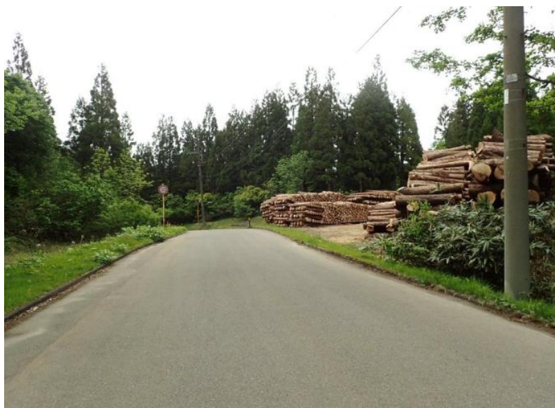
1.2 km先の道路右側に45号～53号巻立