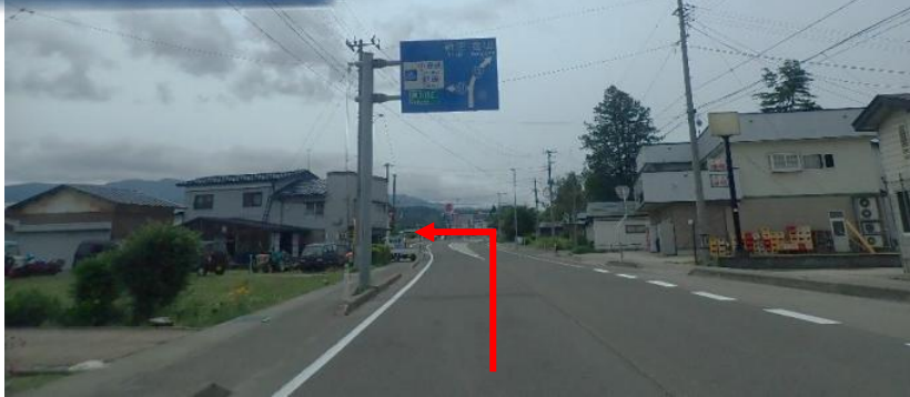
国道13号から県道51号小安峡・泥湯方面へ（須川郵便局の交差点）