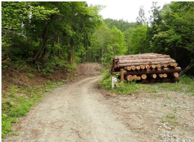
林道起点から250m先まで巻立