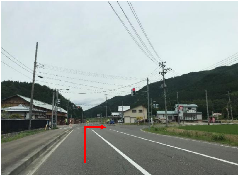
約6.1km先を右折（交差点付近に高松製材所様）