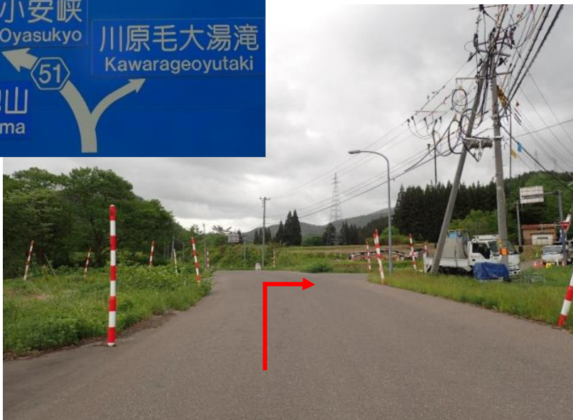
約7.1km先を右折し川原毛大湯滝へ