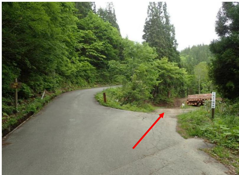
1.2 k m先をワサビ沢林道へ右折