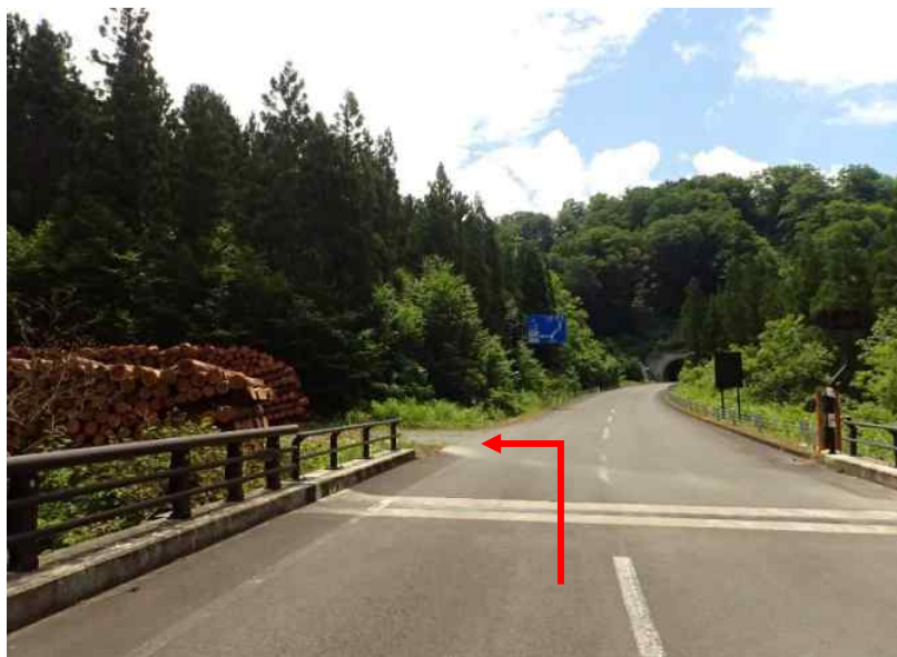
土場3 小安峡大湯温泉から宮城方向へ約5.7 k m先に土場3 (26号・27号)