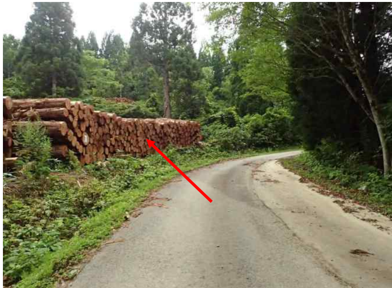
約6.1 k m先道路左脇 (40号)