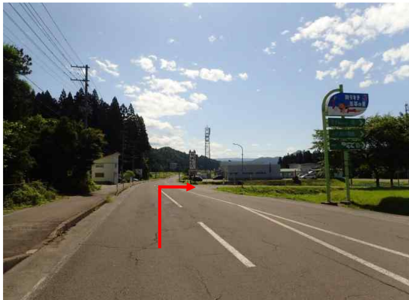
国道342号の増田体育館から東成瀬方面へ向かい約4.4 k m先を右折