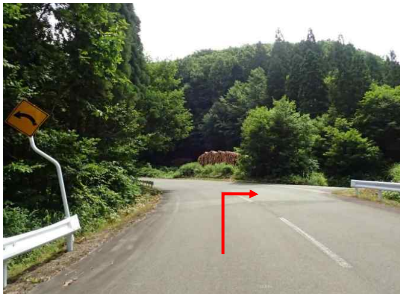
土場2 小安峡大湯温泉から宮城方向へ約2.9 k m先に土場2（18号～24号）