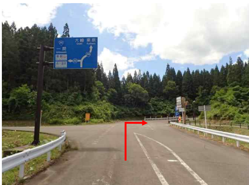
土場4 小安峡大湯温泉から宮城方向へ約6.2 k m先に土場4 (28号・31号～37号)