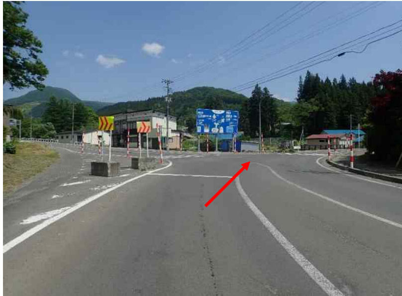
国道342号線 (国道397号分岐) を直進 (栗駒山) 方面へ