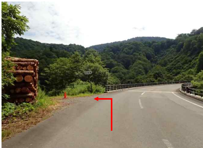
土場3 小安峡大湯温泉から宮城方向へ約4.5 k m先に土場3（25号）