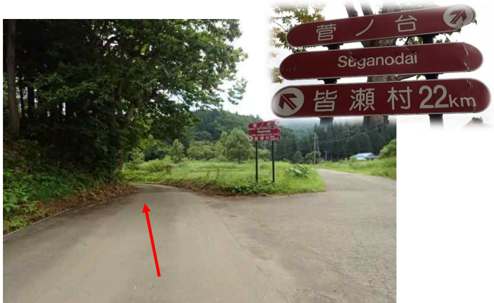
約600m先を左方向 この先全て看板の「皆瀬村」方向へ進む