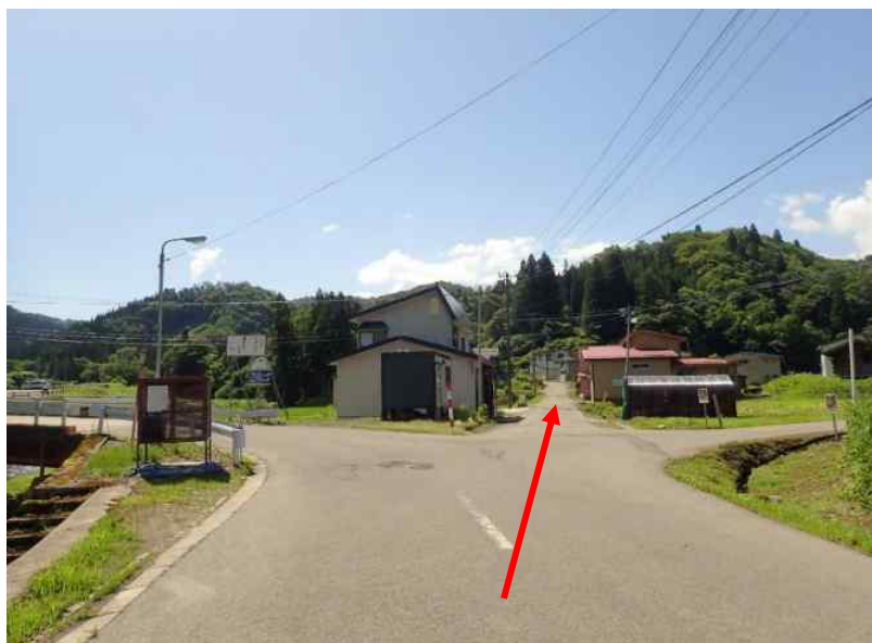
約9.6km先の橋の手前を北ヶ沢林道方面へ