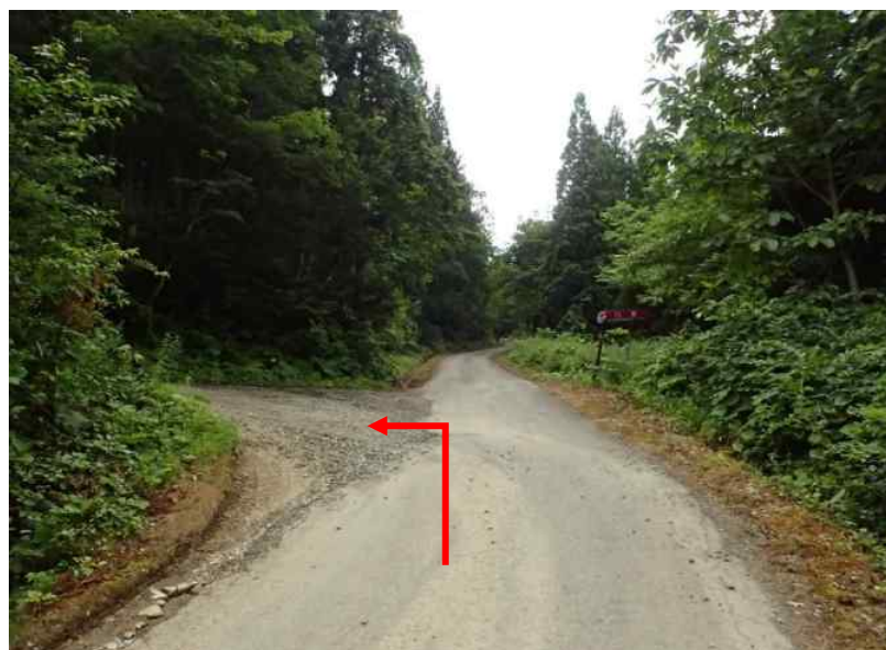
約6.2 k m先を左折 (38号～39号・41号～44号)