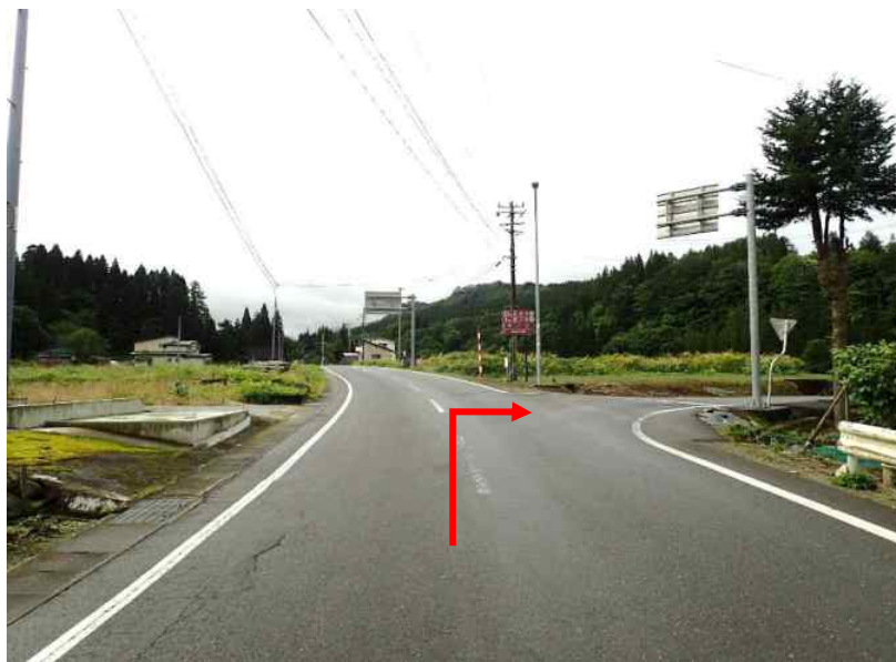
約11 k m 先 県道323号線へ右折