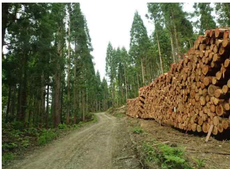
約4km先から物件巻立（事業実行中に付き通行注意ください）