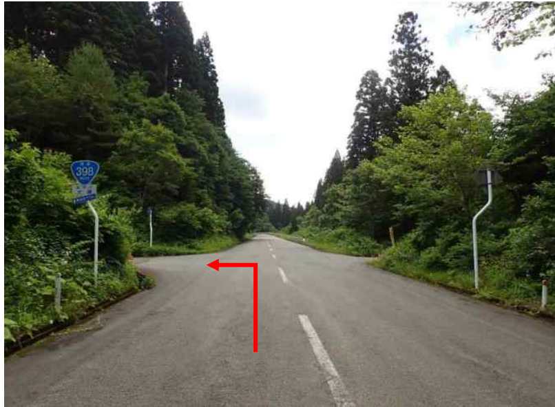
土場1 小安峡大湯温泉から宮城方向へ約400m先に土場1（12号～17号）