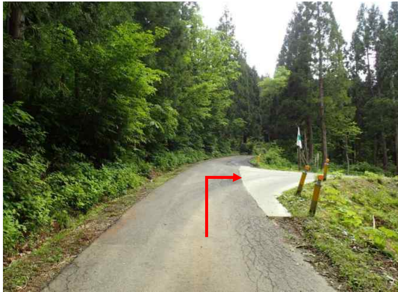
約5.5 k m先を右折 (45号～47号)