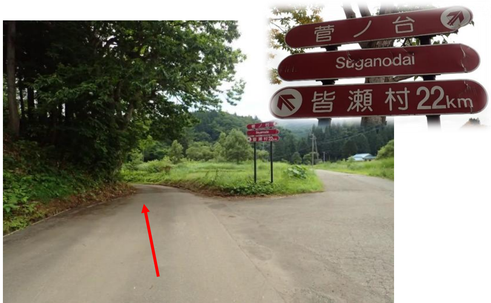
約600m先を左方向 この先全て看板の「皆瀬村」方向へ進む