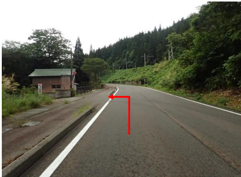
「道の駅おがち」から国道13号線を山形県方面へ約7.5 km先を左折