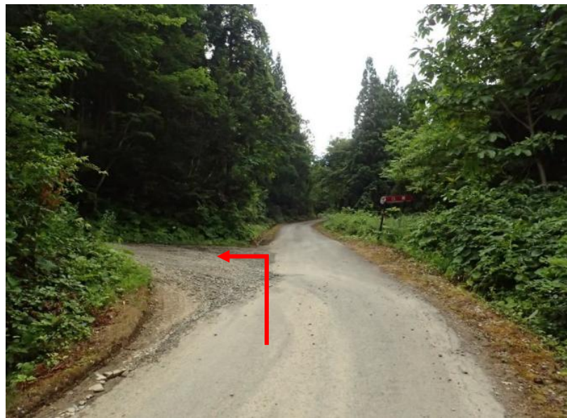
約6.2 k m先を円森林道へ左折 (18号)