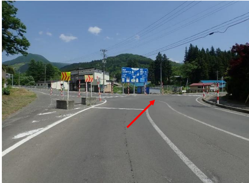
国道342号線（国道397号分岐）を直進（栗駒山）方面へ