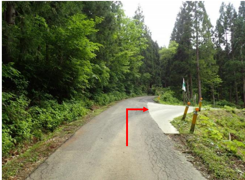
約5.5 k m先をストックポイントへ右折 (10号～17号・19号)