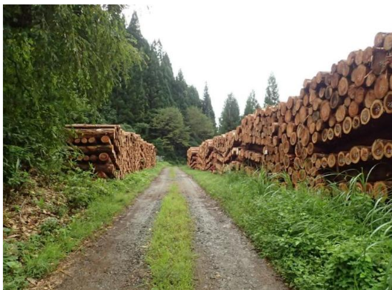
右折した先に一般材・合板材巻立（低質材は林道の2.2 km・2.7 km先）