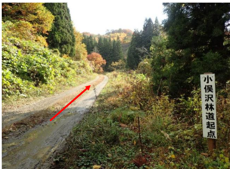
途中から小俣沢林道へ