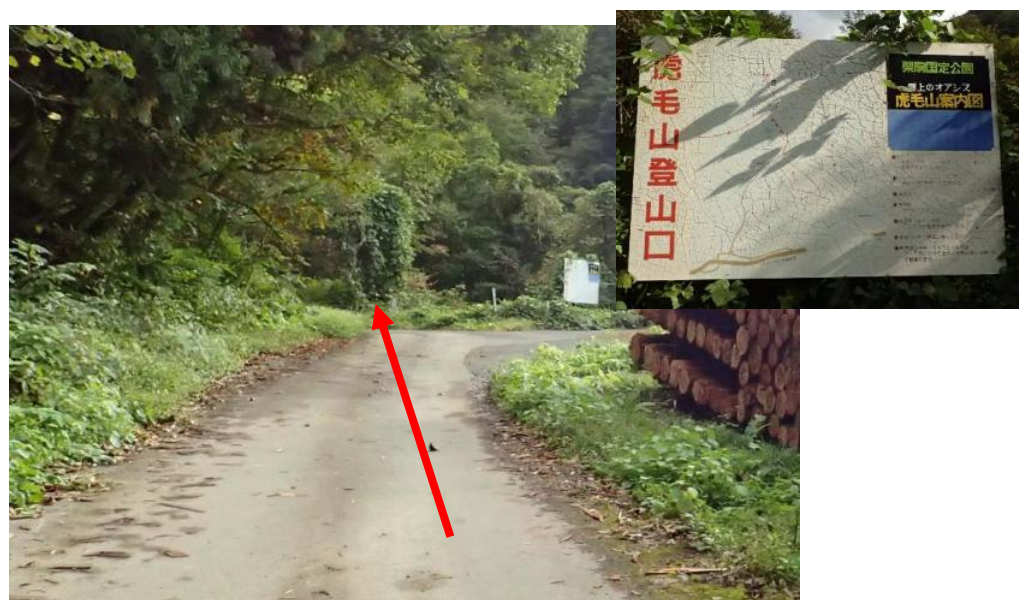
虎毛山登山口入口を直進した先に巻立