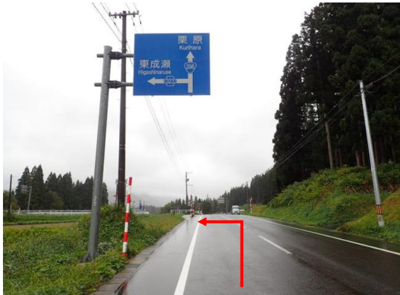
国道398号線から県道323号線 東成瀬方面へ