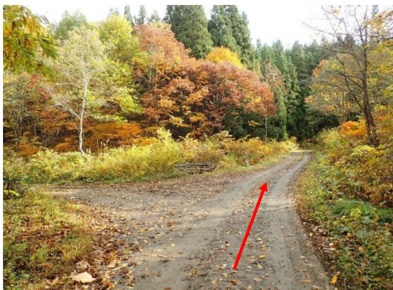
約3 k m先を直進した先に巻立