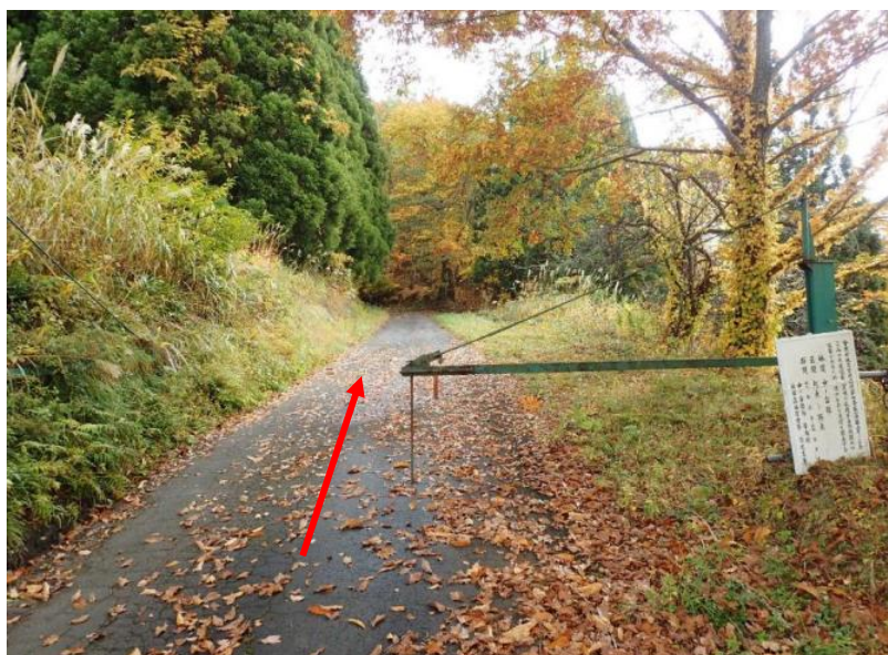
道幅が狭いため、4 t 車での運材が条件となります