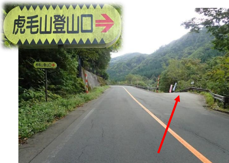
国道13号から19.8 k m（ラ・フォーレ栗駒から1.3 k m）先を右方向へ