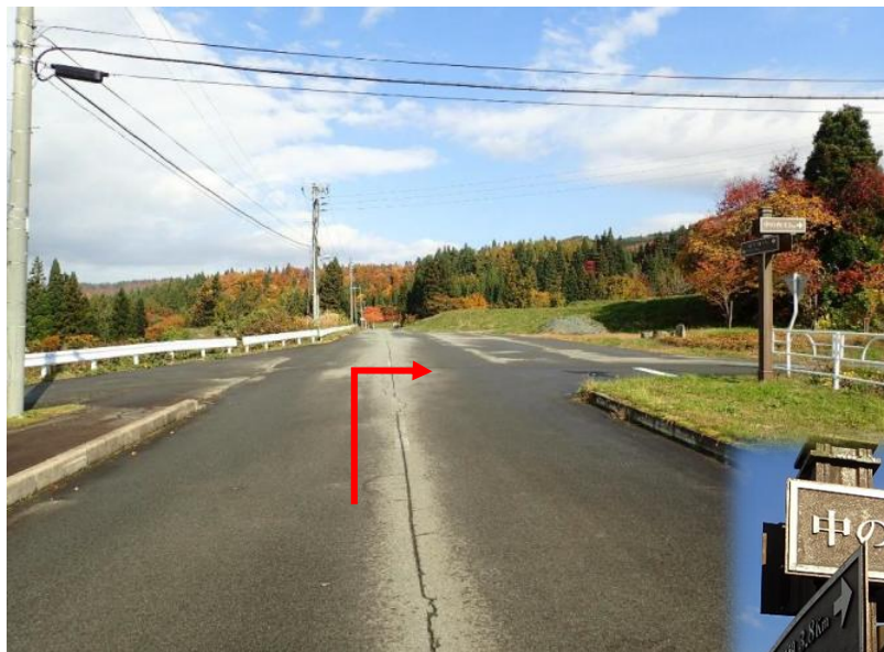
約3.9 km先 宇宙大橋を越えてすぐに右折