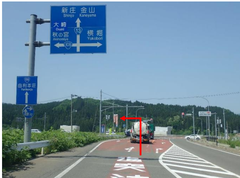
国道13号線から国道108号線（大崎・秋ノ宮）方面へ