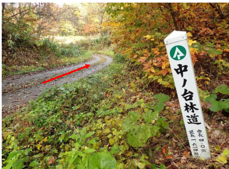
途中から中ノ台林道へ